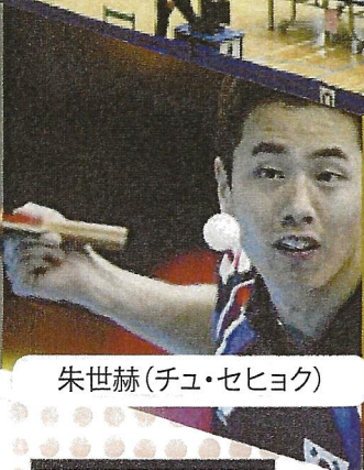
朱世赫 (チュ・セヒョク)