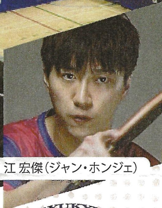
江宏傑 (ジャン・ホンジェ)